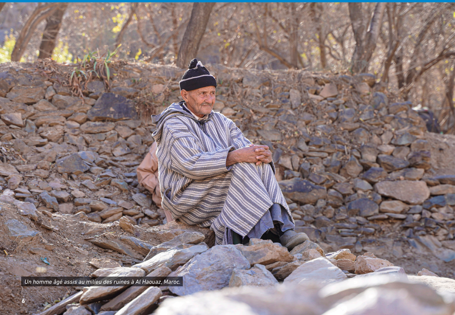
Un homme âgé assis au milieu des ruines à Al Haouz, Maroc.