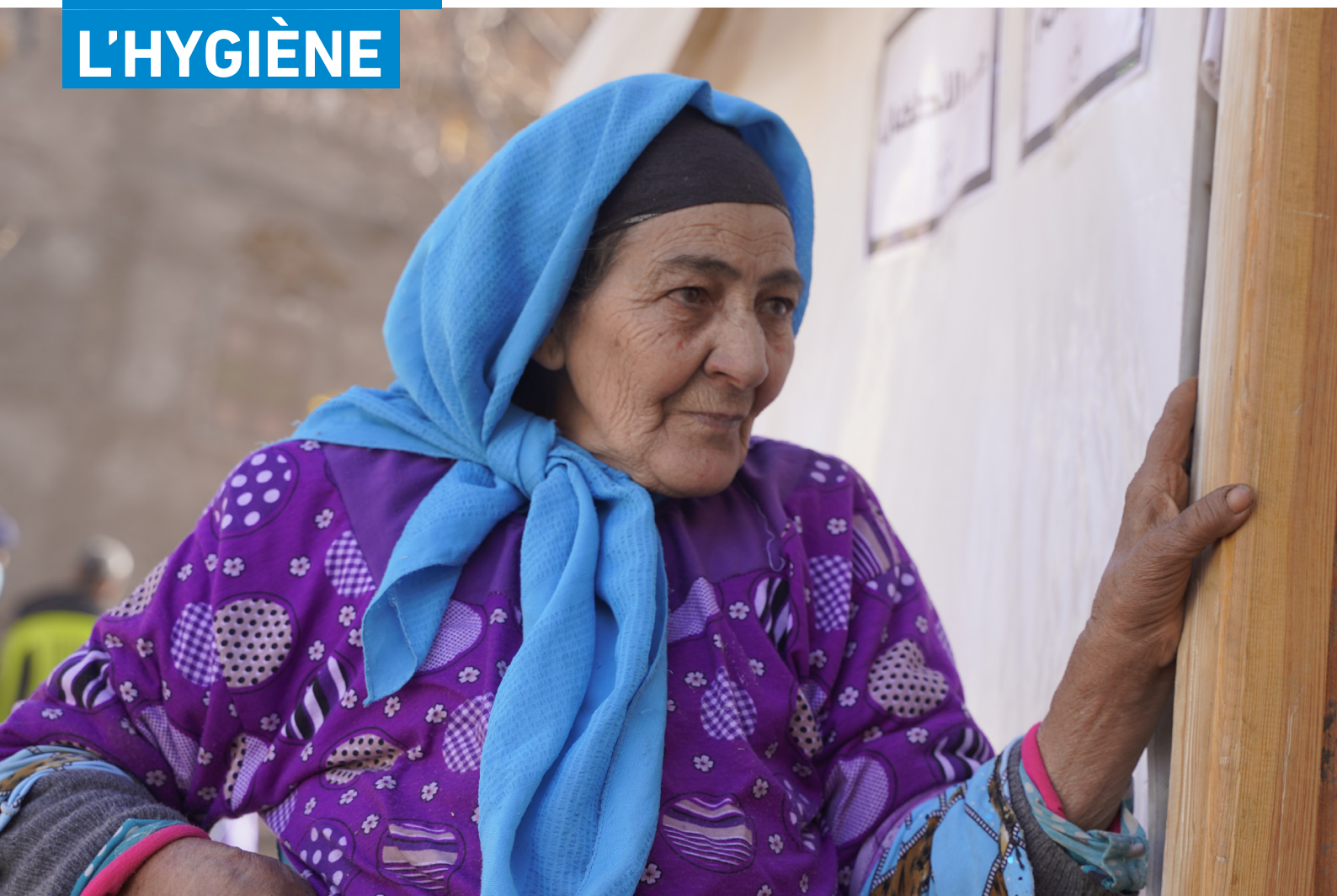
Une femme de la région de Marrakech, au Maroc, entre dans une clinique mobile d'Islamic Relief. Connues sous le nom de « caravanes de la santé », ces cliniques fournissent des services de soins de santé primaires aux communautés isolées

AMÉLIORER L'ACCÈS À LA SANTÉ ET À L'HYGIÈNE