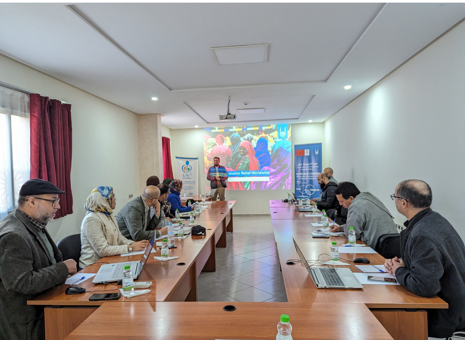
Le personnel de l'association Al Mobadara reçoit une formation de renforcement des compétences de la part d'Islamic Relief

Lorsque des catastrophes frappent, les associations caritatives locales et les organisations de la société civile sont souvent parmi les premières à réagir. Profondément enracinées dans les populations qu'elles servent, elles ont une connaissance approfondie des besoins locaux, ce qui les rend indispensables pour les initiatives de développement. C'est pourquoi Islamic Relief soutient la croissance des partenaires locaux afin de renforcer leur capacité à répondre aux urgences et à contribuer au développement des populations. Au Maroc, nous avons lancé un programme de formation complet pour deux partenaires locaux, qui développent leurs compétences dans des domaines importants tels que la conception de programmes, les finances, la logistique, ainsi que la création de rapports et d'évaluations.