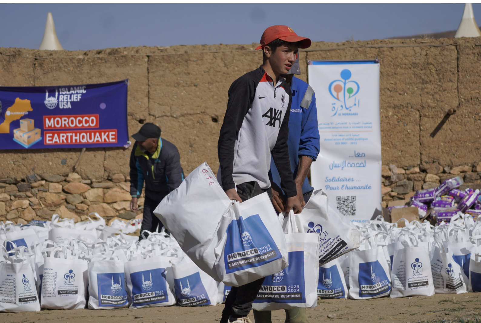
Un garçon collecte des produits de première nécessité distribués dans le cadre de notre intervention d'urgence dans la province d'Al Haouz

En collaboration avec deux associations caritatives locales, nous fournissons des colis alimentaires aux familles en difficulté, ainsi que des produits d'hygiène, tels que du savon, pour aider à prévenir la propagation de maladies. Nous avons également fourni des produits d'hygiène aux écoliers, ainsi que des articles de survie pour l'hiver, tels que des manteaux, des bottes et des bonnets, bénéficiant jusqu'à présent à plus de 11 600 enfants.