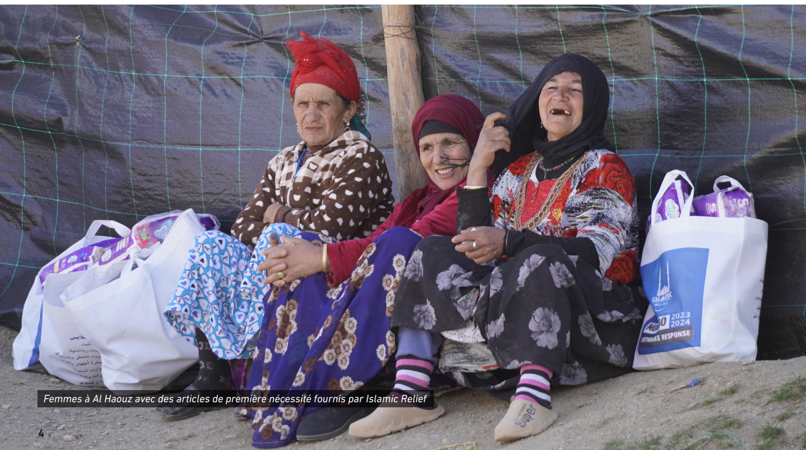
Femmes à Al Haouz avec des articles de première nécessité fournis par Islamic Relief